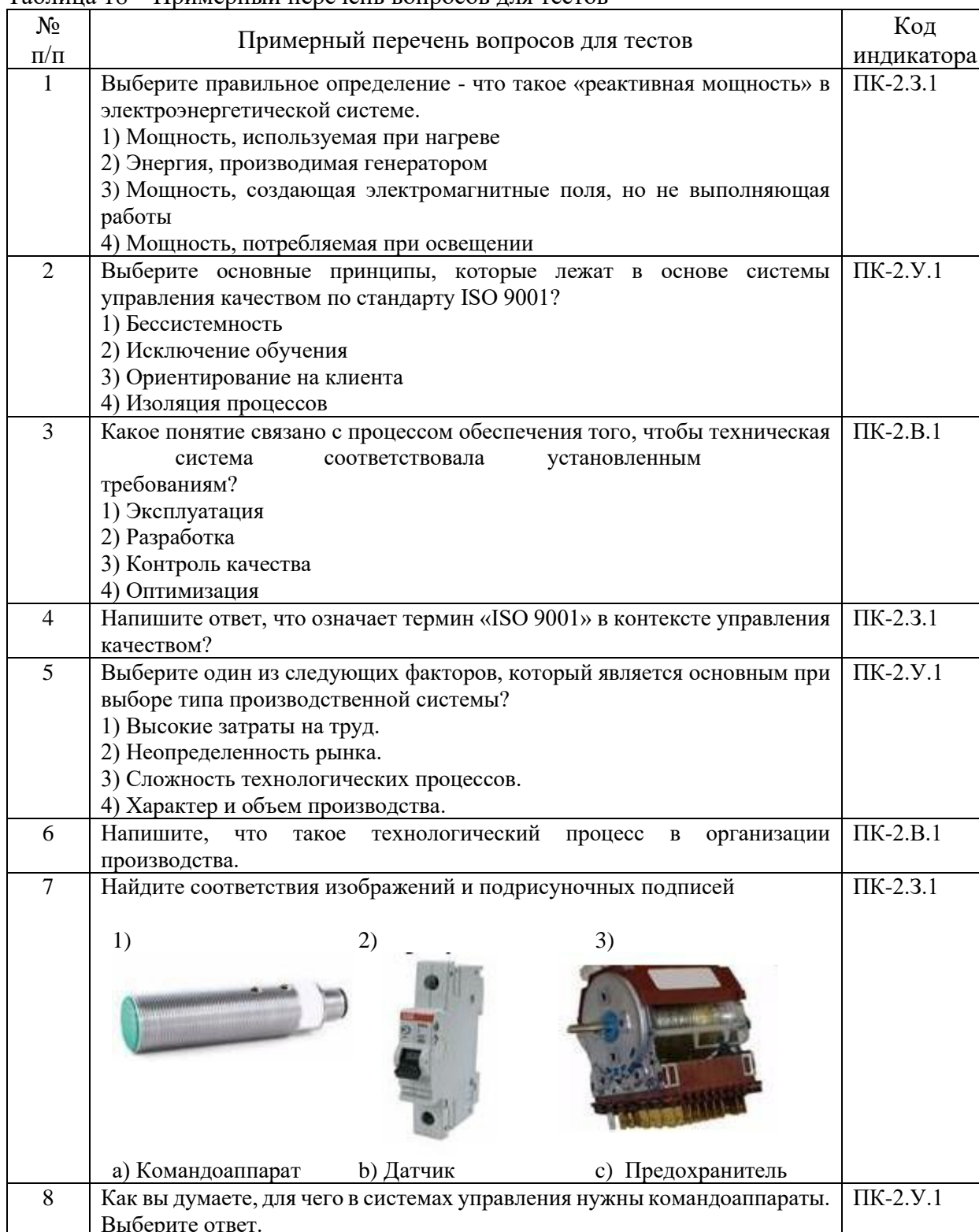
Таблица 18 – Примерный перечень вопросов для тестов

Вопросы для проведения промежуточной аттестации в виде тестирования представлены в таблице 18.